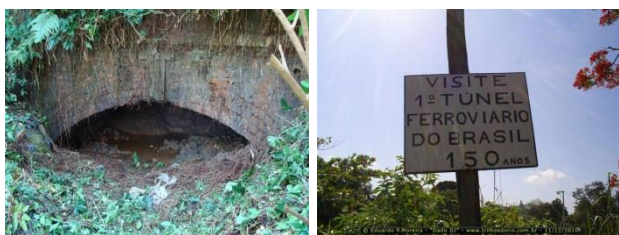
Acima: boca do túnel até bem pouco tempo