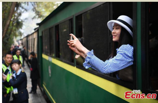
Acima: simpática turista chinesa curtindo a viagem.

Acima: trem turístico de Jiayang atravessando campos com flores e pessegueiros em Qianwei, província de Sichuan, sudoeste da China. Esse trem é uma grande atração, especialmente no início da primavera, quando as flores desabrocham ao longo da ferrovia.